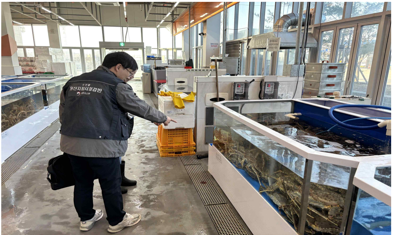
수산물 원산지 표시 점검·단속 사진2