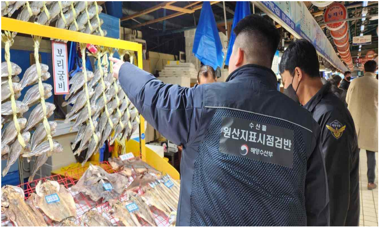
수산물 원산지 표시 점검·단속 사진1