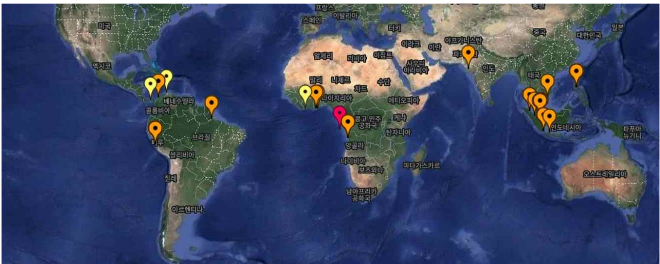
【연도별 1분기 해적사건 발생 건수(2019 ~ 2023)】