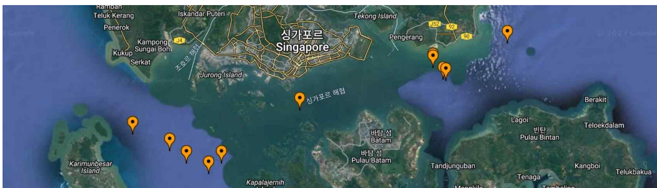
【1분기 싱가포르 해협 해상강도사건 발생 현황】

☞ 싱가포르 해협에서 선용품 탈취 목적의 해적 활동이 증가하고 있으므로, 야간 통항 시 견시원 추가 배치 등 철저한 대비 필요