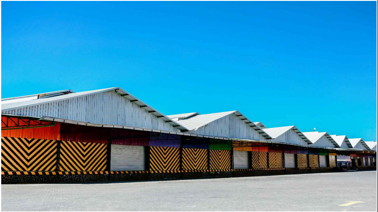
수라바야항 물류센터 전경