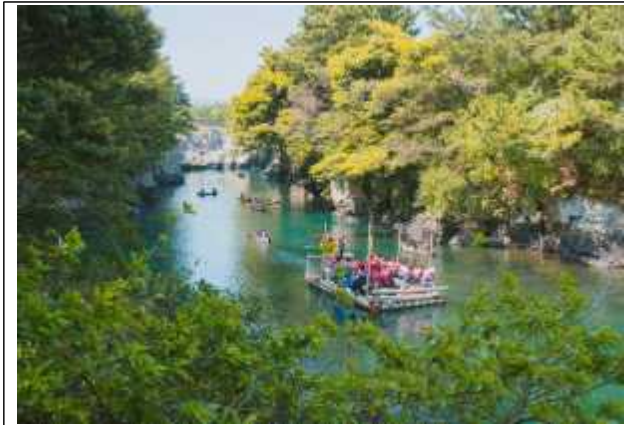
위미리마을 쇠소깍 체험