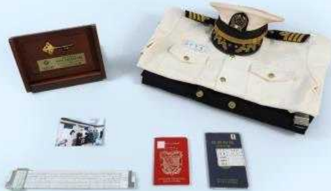
1990~2000년대 | 46.0×77.0cm 등 | 국립인천해양박물관 소장 | 양종면 기증

해방사, 해영교류(해운·항만), 해당예술, 해군민속, 해양과학, 해양산업, 각종 어업·항해도구 등 다양한 해양 관련 자료