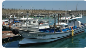
한국 : 22.7톤/척 (88만톤/39,066척)