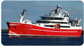
노르웨이 : 443.8톤/척 (244만톤/5,503척)